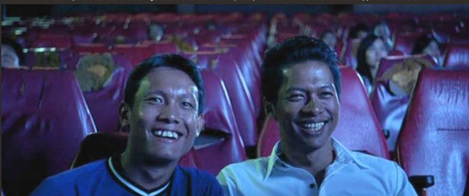
El Cine de Tailandia, el Cine de Joe >>

Cultura y Arte en Caracas Venezuela. Agenda de eventos artísticos caraqueños y medio alternativo de noticias en sociedad y política internacional.