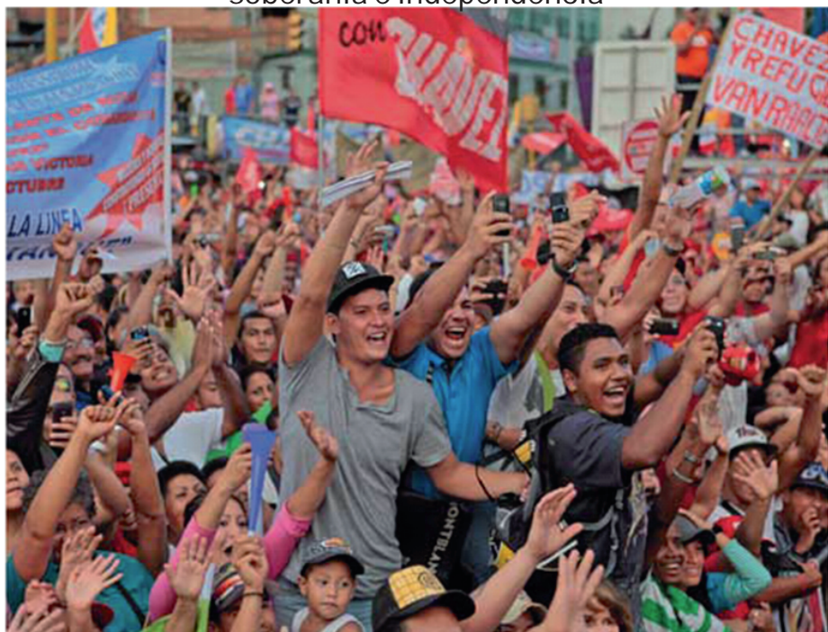
La misión 07 de Octubre sigue su curso. El candidato de la patria recibe el apoyo entusiasta de miles de jóvenes.