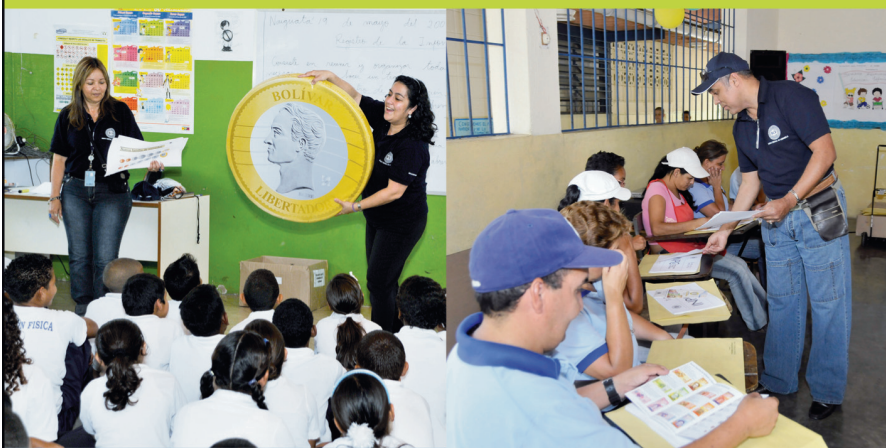
Escuela Nacional de Naiguatá, estado Vargas.